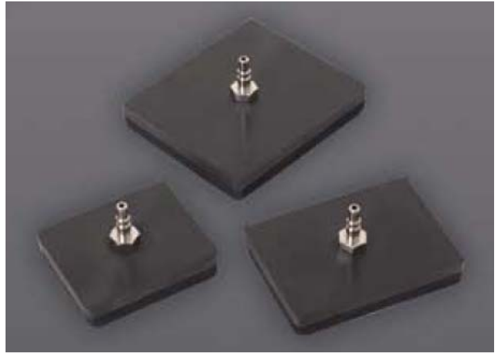
Дополнительный комплект адаптеров