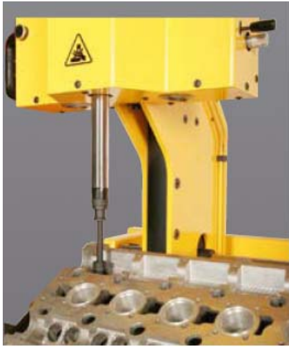
Инструмент для замены направляющих втулок с защитой гнезд гидрокомпенсаторов.