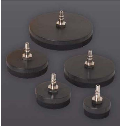
Стандартный комплект адаптеров