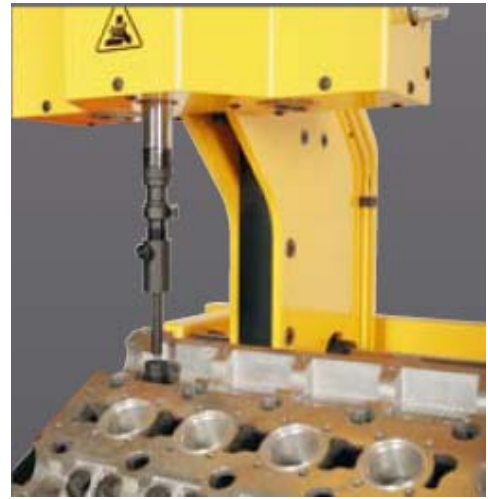
Монтажный инструмент для направляющих клапана с широким регулированием по глубине.